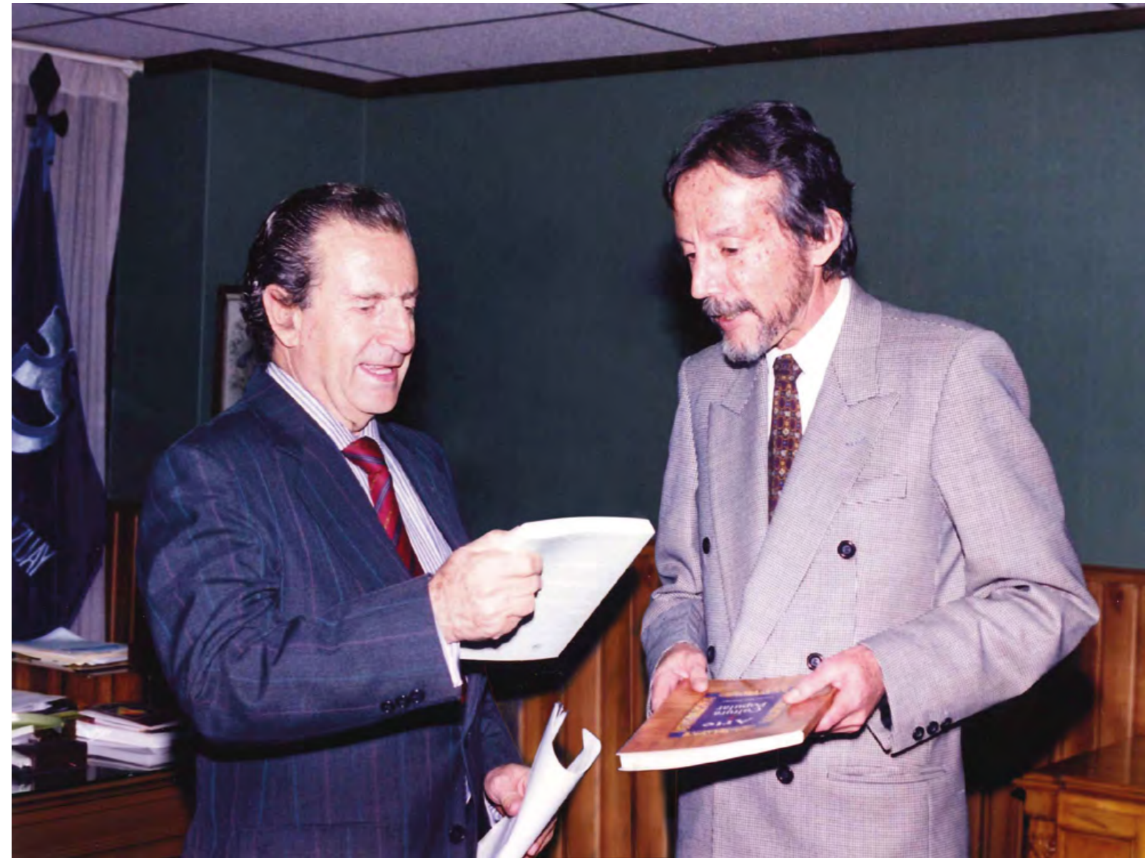
El expresidente de la República Rodrigo Borja visita la Universidad del Azuay, 1999.