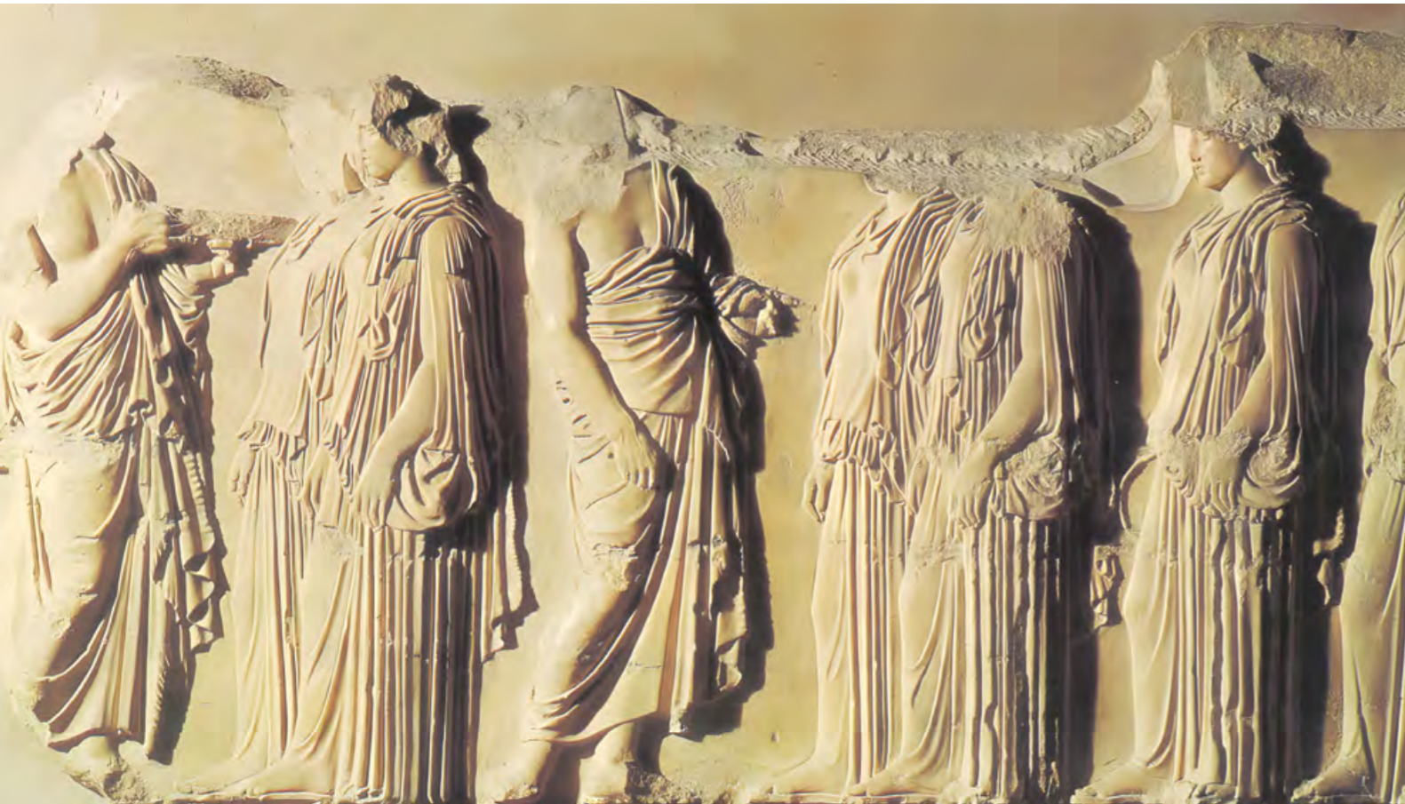
Fidias, fragmento del friso de las Panatheneas en el Partenón, Atenas, 443 y 438 a. C.