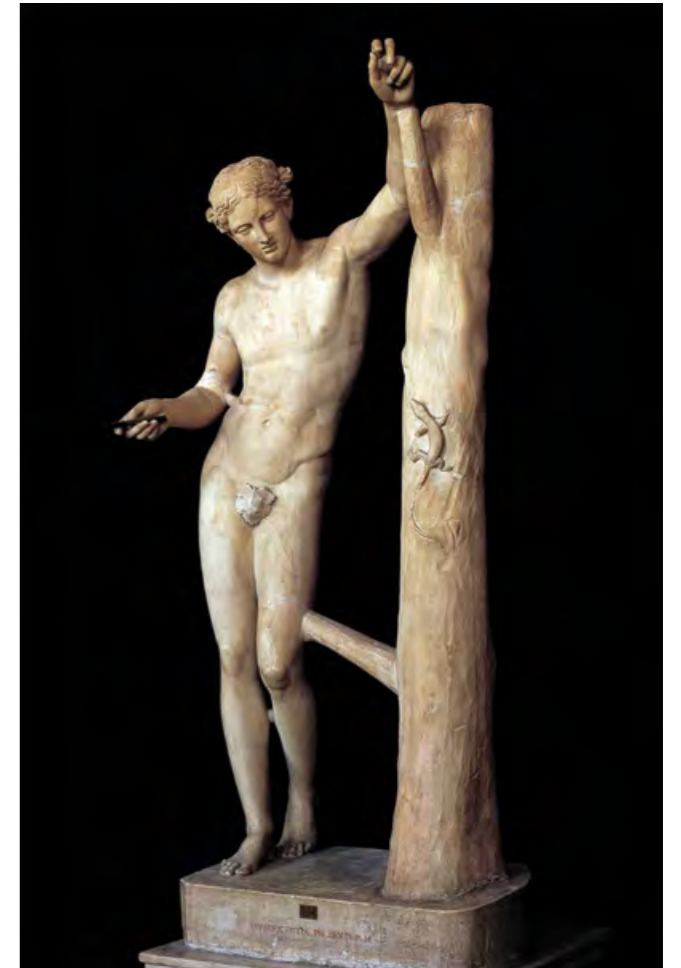
Praxiteles, Apolo Sauróctano , Atenas, 350 a. C.

No hay hipérbole en decir que estas fueron las clases más gratas y memorables de toda nuestra formación universitaria.