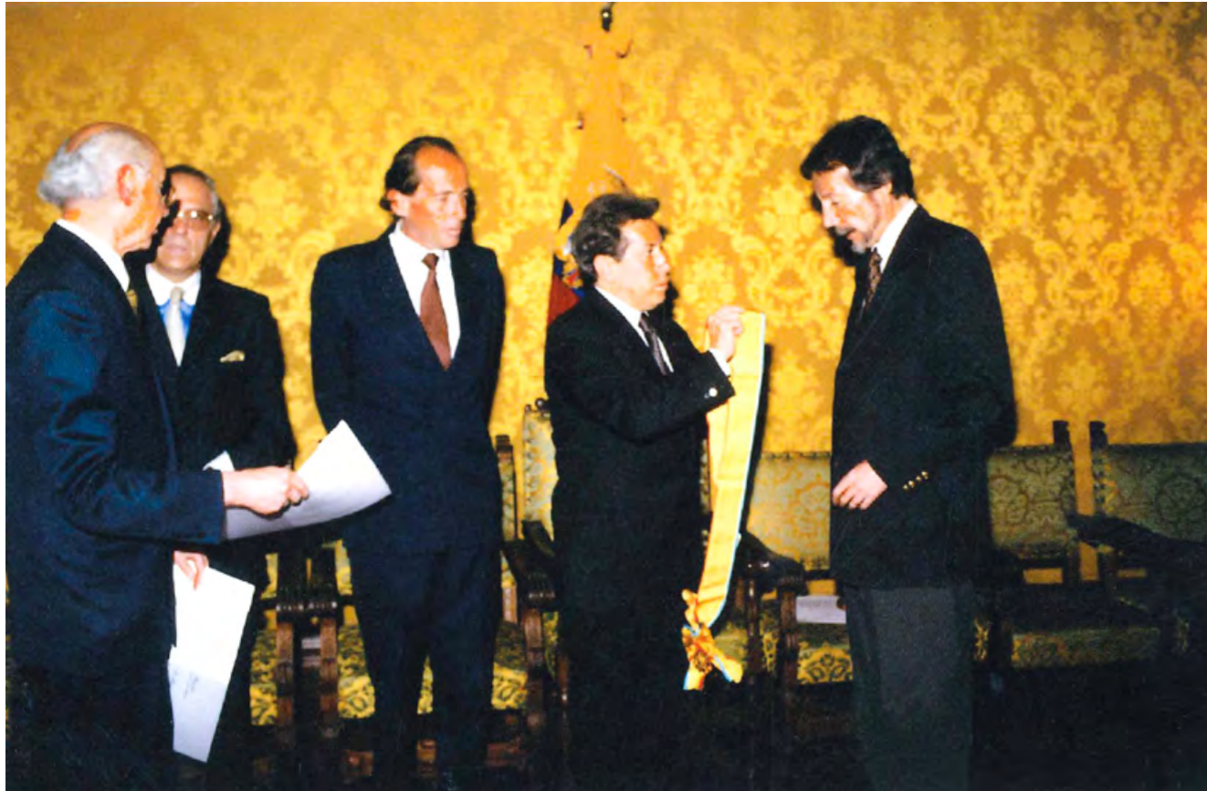
Condecorado por el presidente de la República Fabián Alarcón con la Orden Nacional al Mérito en el grado de Gran Cruz, Palacio de Gobierno, Quito 1998.