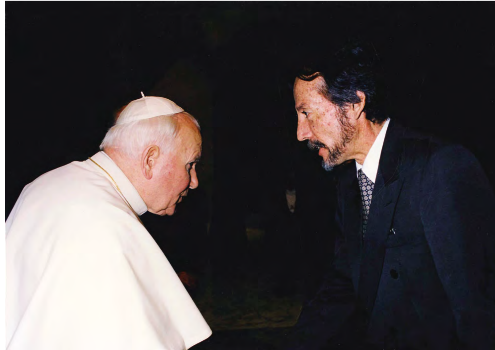
Audiencia con el Papa Juan Pablo II, Roma, 1998.